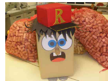
Escola do 2.º e 3.º Ciclos Dr. Horácio Bento de Gouveia no Funchal