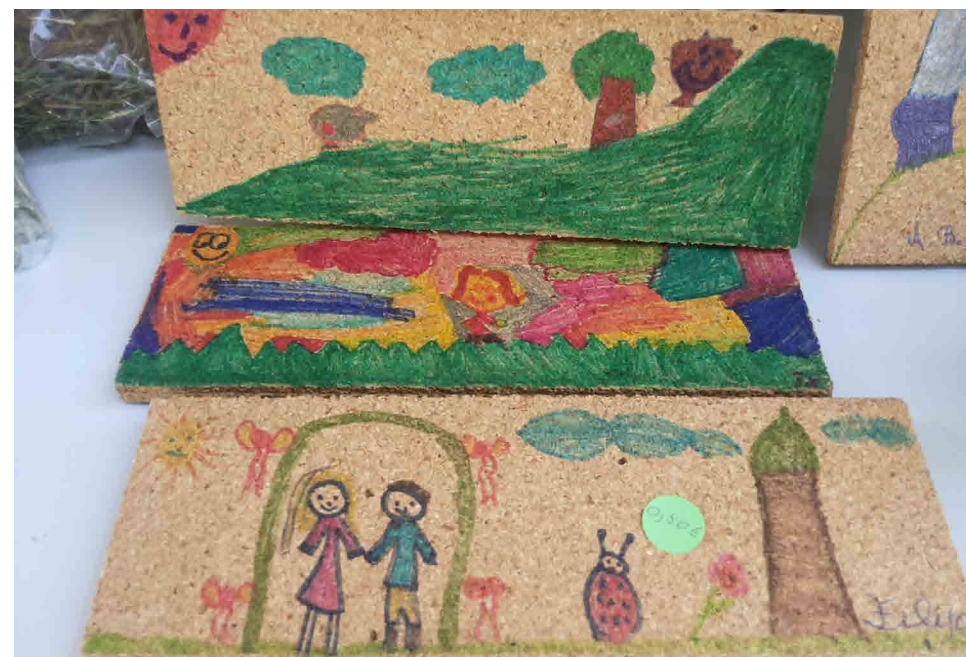
Escola Básica das Abadias