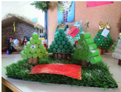
E.B. 2/3 de Palmeira