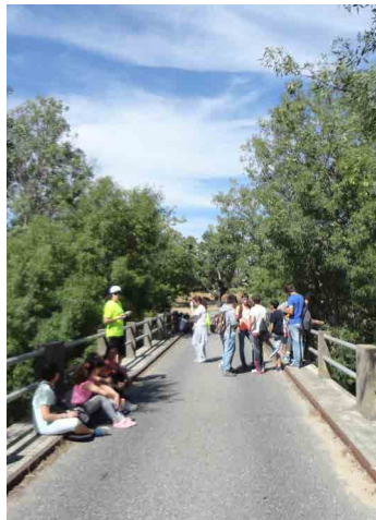
Escola Básica e Secundária de Alcains