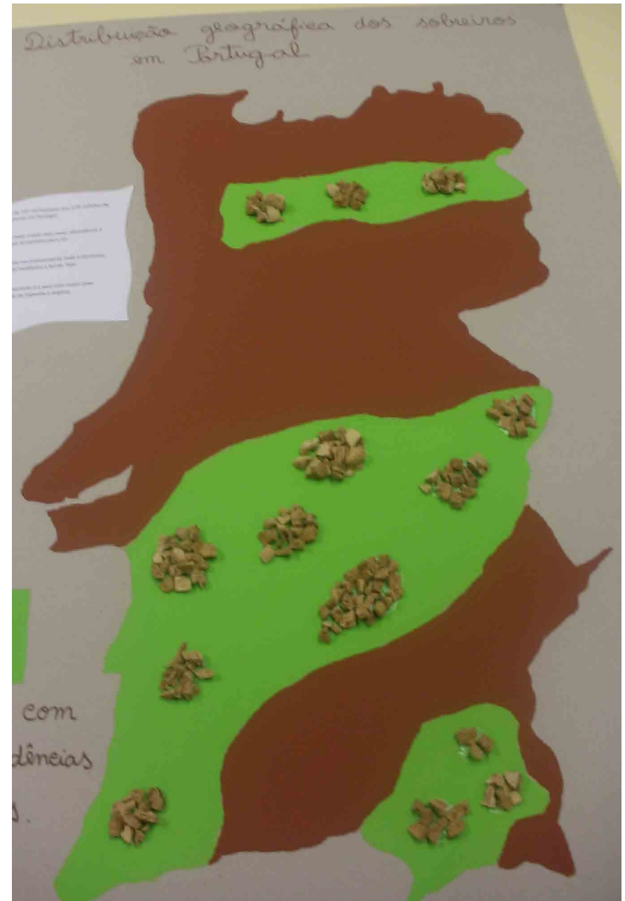
Escola Dr. Horácio Bento de Gouveia