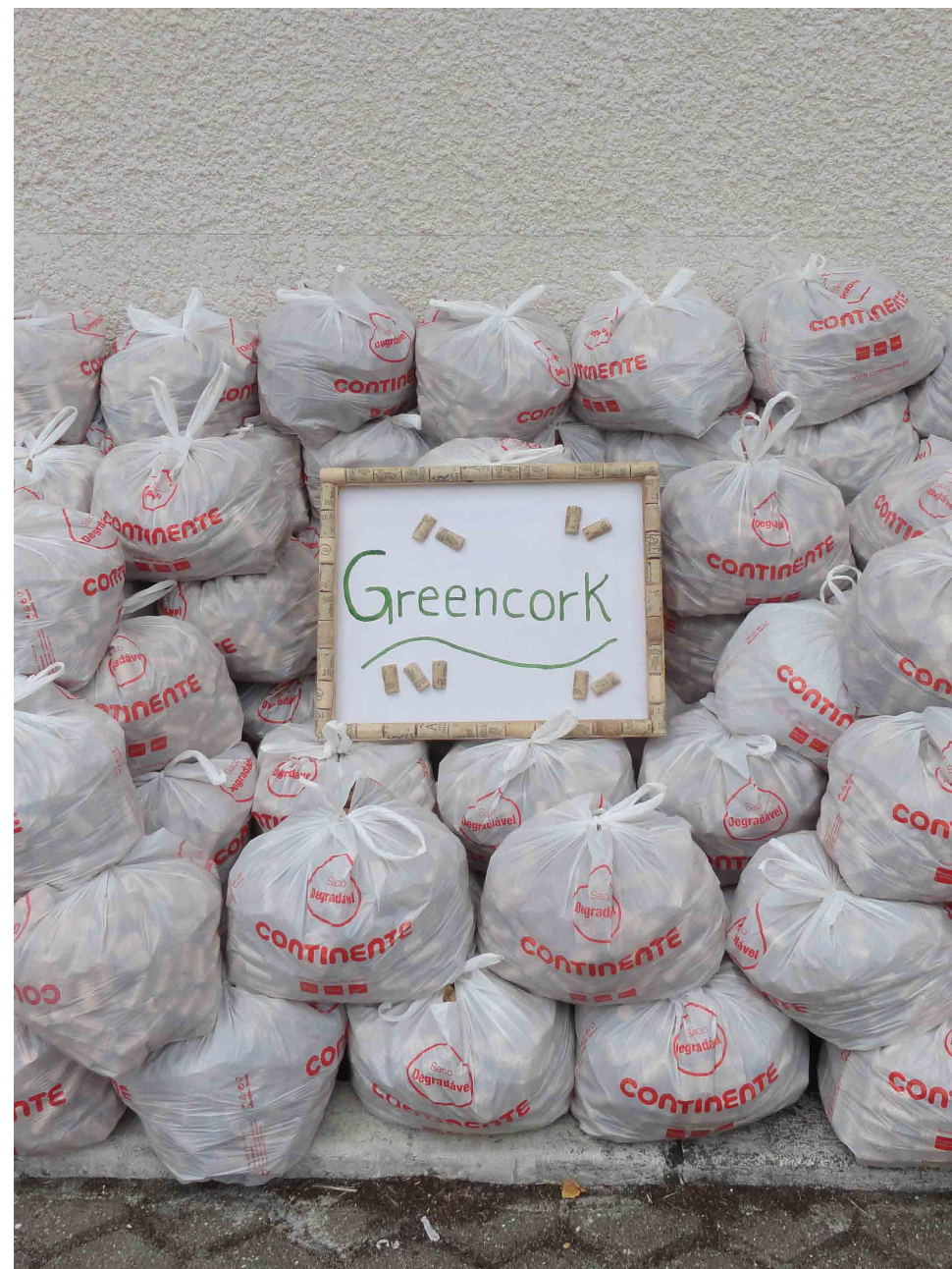
Colégio Diocesano de Nossa Senhora da Apresentação

Este programa conta assim com a participação de escolas e agrupamentos escolares de todo o país.