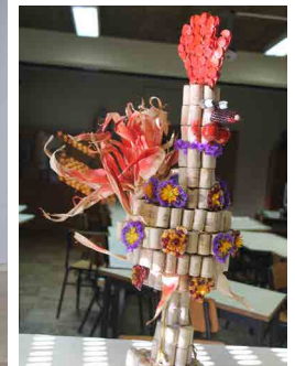
E.B. 2/3 Abel Varzim