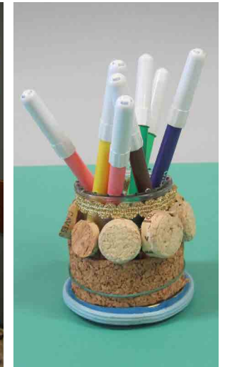
Escola Vilar de Andorinho