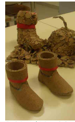
Escola Dr. Horácio Bento de Gouveia Botachas ou bota-chã