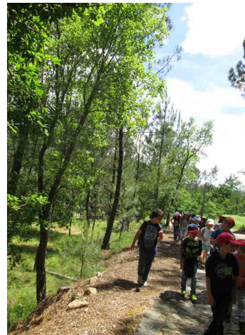
Escola Básica S. Sebastião