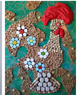
Agrupamento de Escolas Dr. Carlos Pinto Ferreira Junqueira