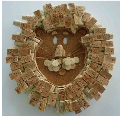
2º Jardim Escola João de Deus - Coimbra Vencedor 1º e 1º Ciclo

O Carnaval é uma época de grande entusiasmo para todas as crianças. Por esta razão, nesta edição, o Green Cork Escolas decidiu convidar as escolas a criarem uma máscara de Carnaval que contivesse algum acabamento em cortiça. Cada escola escolheu 1 disfarce. Por votação no Facebook e avaliação do júri, foi eleito um vencedor por cada grupo de escolaridade. O 2º Jardim Escola João de Deus - Coimbra foi vencedor no grupo de jardins escolas e 1º ciclo, a E.B. 2/3 Alfredo da Silva foi a vencedora no grupo de 2º e 3º ciclo, e a Escola Mães D'Água foi vencedora no grupo do Secundário.