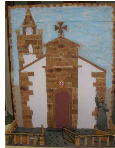
Escola Dr. Horácio Bento de Gouveia | Sé do Funchal