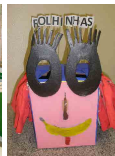
Escola do 2.º e 3.º Ciclos Dr. Horácio Bento de Gouveia no Funchal