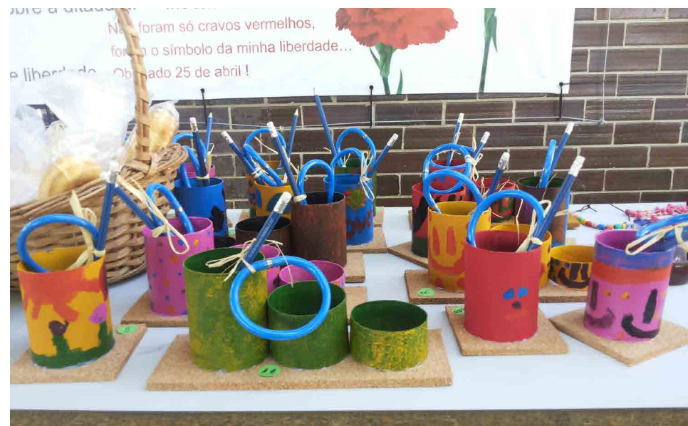
Escola Básica das Abadias

Para o ano letivo de 2013/14, foram propostas às escolas cinco atividades: "Recolha de rolhas de cortiça"; "Confeção dos Rolhinhos"; "Concurso - Máscaras de Carnaval com cortiça"; "Concurso: Galo de Barcelos com cortiça"; "Construir com cortiça". As escolas vencedoras do concurso de Máscaras de Carnaval com cortiça foram: 2º Jardim Escola João de Deus - Coimbra no grupo escolar de jardins de infância e 1º ciclo; a E.B. 2/3 Alfredo da Silva no grupo escolar do 2º e 3º ciclo; e a Escola Mães D'Água no grupo escolar do secundário. O Galo de Barcelos vencedor foi o da Escola Básica Pedro Jacques de Magalhães, tendo sido eleito como a mascote oficial do Green Cork Escolas 2013/14.