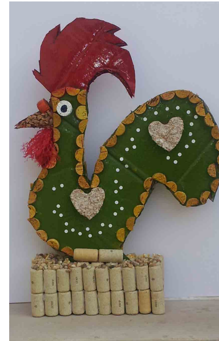
Escola Básica Pedro Jacques de Magalhães Vencedor do Concurso | Mascote Green Cork Escolas 2013/14

A seleção da nova mascote - Galo de Barcelos, foi realizada por votação online no Facebook do Green Cork. Venceu o galo com o maior número de gostos, o da Escola Básica Pedro Jacques de Magalhães, com 1.690 gostos.