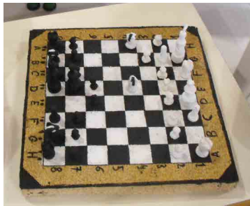
Agrupamento de Escolas de Arganil

A cortiça é um material plenamente versátil, de fácil reutilização e reciclagem para a construção de novos objetos. Propusemos aos Green Cork Escolas que desafiassem a sua criatividade e dessem uma nova vida às rolhas de cortiça. Construíram uma diversidade de objetos que permitiram aos alunos o desenvolvimento de várias capacidades, levando-os a articular o saber, a razão e a emoção, ampliando a sua conceção estética. Permitiu também a organização de feiras de artesanato com vista à angariação de fundos monetários para ações de (re)arborização com plantas autóctones, organizadas pelas escolas.