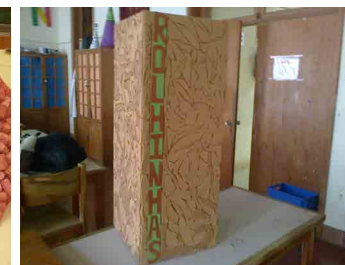
Escola Básica de Santa Bárbara