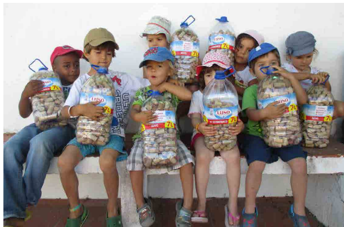
Jardim de Infância de Zambujeira do Mar

A recolha de rolhas de cortiça contou com a participação de inúmeras pessoas, tendo-se destacado os alunos e o pessoal docente.