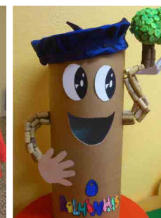
Jardim de Infância Santa Casa da Misericórdia de Caminha