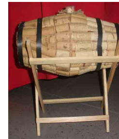
Escola Dr. Horácio Bento de Gouveia