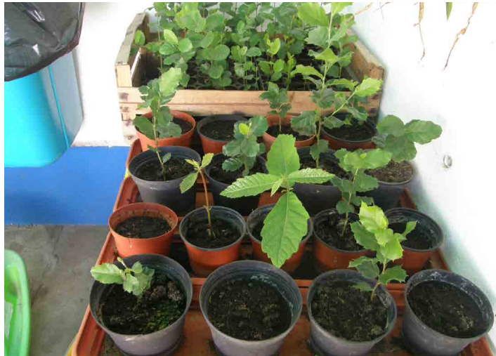
Escola Básica da Zambujeira do Mar

Além das atividades propostas, o Green Cork Escolas promove e deixa em aberto um espaço para atividades com iniciativa na comunidade escolar. Destacam-se a criação de um mapa da distribuição geográfica dos sobreiros em Portugal, realização de visitas de estudo para observação de sobreiros e ações de sementeira.