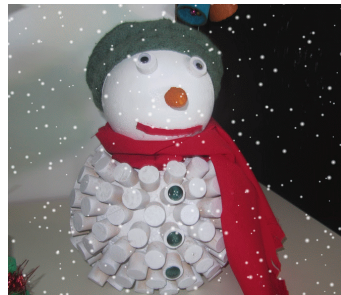
E.B. 2/3 de Palmeira