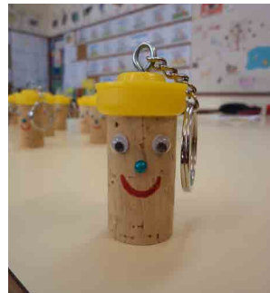
Escola Básica e Jardim de Infância Águeda