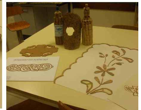
Escola Dr. Horácio Bento de Gouveia | Bordado da Madeira