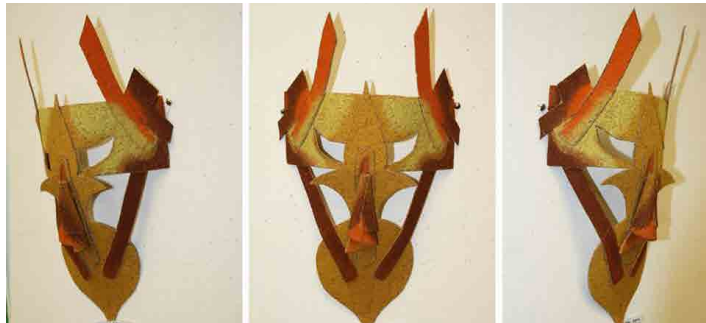
Escola Mães D'Água | Vencedor Secundário