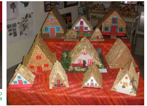
Escola Dr. Horácio Bento de Gouveia | Casas de Santana