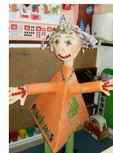
A Creche Sempre em Flor

Se seguida algumas fotos dos Rolhinhas criados pelas Green Cork Escolas: